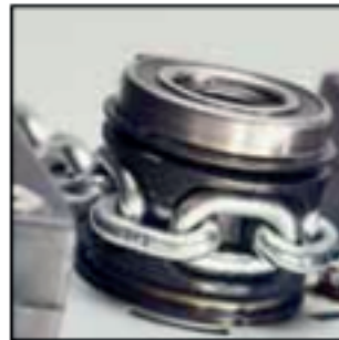
La polea de carga mecanizada de precisión asegura un movimiento exacto de la cadena de carga.

! Los polipastos y carros Yale no han sido diseñados para aplicaciones de elevación de personas y no deben ser usados con ese propósito.